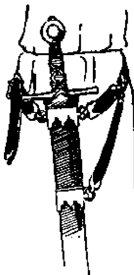
Рис. 46. Крепление перевязи к ножнам в начале XIV века; при таком способе вместо оборачивания ножен ремнем использовали замки и кольца

С появлением «международного» стиля пластинчатых доспехов в третьей четверти XIV века на средневековой сцене появляется также и новый способ крепления перевязи к ножнам. Пояс перевязи теперь не спускался по диагонали к левому бедру, но располагался горизонтально низко на бедрах. Меч подвешивали с левой стороны одним из двух способов. Либо для крепления меча использовали крючок на поясе, к которому ножны подвешивали за специальное кольцо, расположенное на заднем краю ножен, либо для этого использовали пару коротких ремней, которые пристегивали к пряжкам на заднем краю ножен. Большинство перевязей такого типа были богато украшены квадратными или круглыми пластинами красивой ювелирной работы (рис. 46 и 47), причем каждое такое украшение соединялось с соседними с помощью петель.